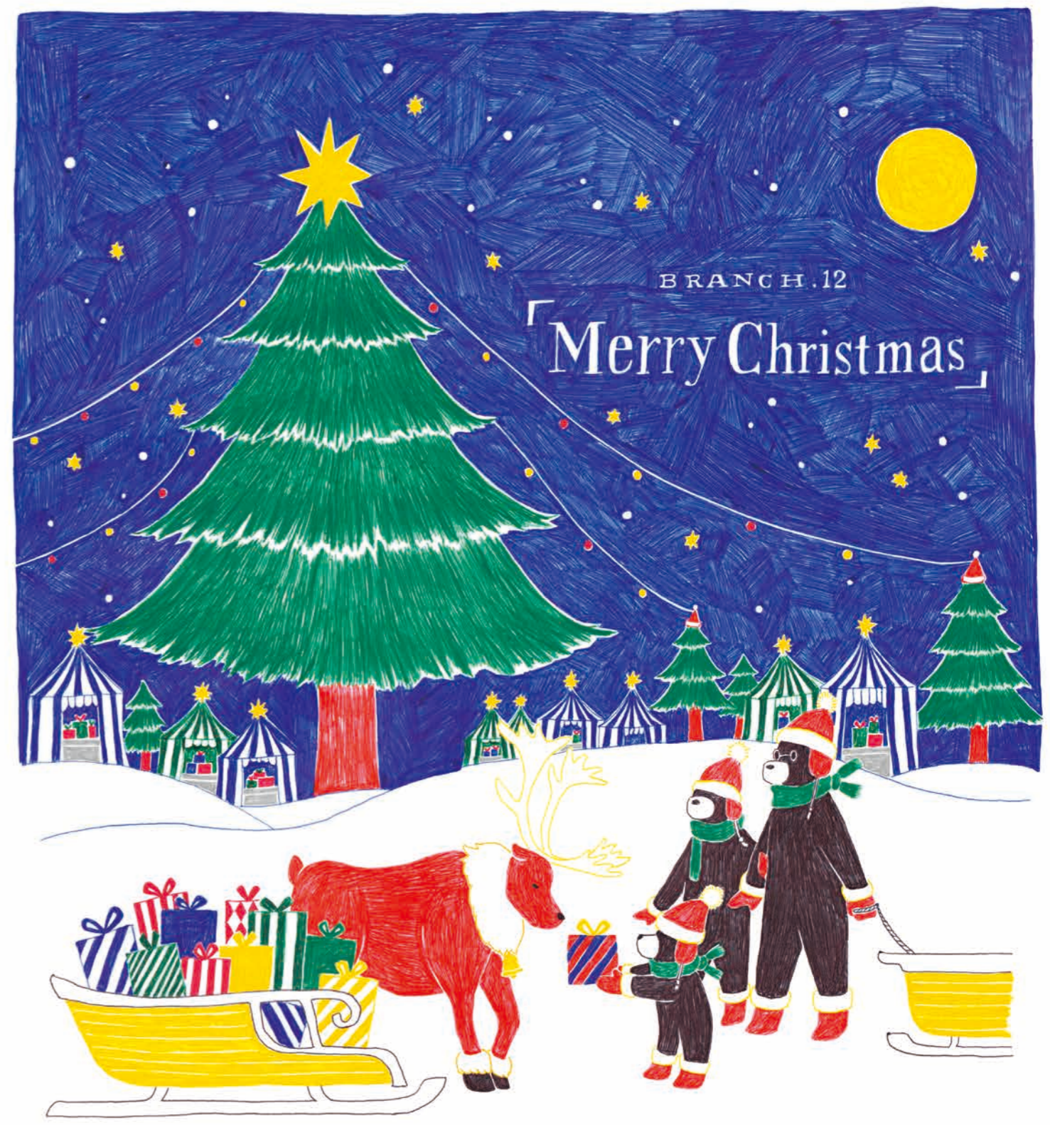
森ではクリスマスマーケット♪ トナカイさんほみんなに買ったプレゼントをたくさん買、たみたい! さあさあ何かもらえかな?