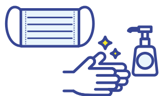
従業員の マスク着用・手洗い