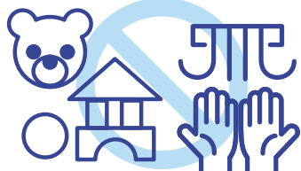
共用スペースの 一部利用停止