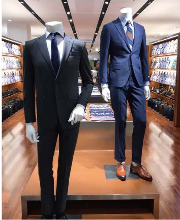
夏オススメの涼しげなカラーから、ナチュラルな着こなしができるカラーまで。豊富なラインナップをご用意しております。コーディネートに迷ったらスタッフまでお気軽にご相談くださいませ。

卒業・入学・就職そして新生活。様々なシーンに合わせてブランチ茅ヶ崎2から新生活の装いをご提案します。旬のアイテムから日常生活に欠かせないアイテムまで。皆さまのご来場をお待ちしております。